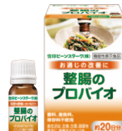
整腸のプロバイオ

お申し込みの際の注意事項がございますので、申込フォームをご参照の上、ご登録ください。