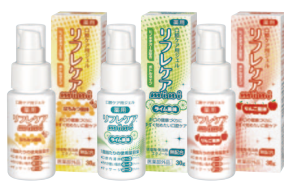
薬用 口腔ケア用ジェル リフレケア med