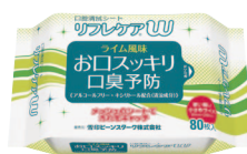
口腔清拭シート リフレケア W