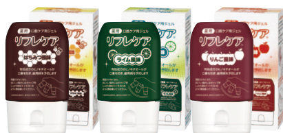
薬用 口腔ケア用ジェル リフレケア